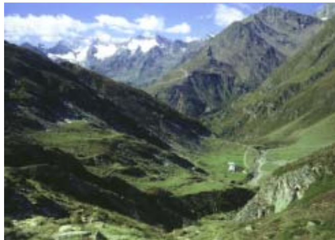
Timmelsalm im obersten Passeiertal

Südöstlich des Alpenhauptkammes, der zwischen Sonklarspitze und Timmelsjoch die heutige Staatsgrenze zwischen Österreich und Italien bildet, verbirgt sich ein stilles, aber außergewöhnlich reizvolles Wandergebiet, mittendrin der oberste Abschnitt des schönen Passeiertales. Es zieht sich von der Timmelsjochstraße auf 12 km Länge in mehreren Terrassen bis zur Schwarzwandscharte hinauf, die den Übergang zum großen Übeltalferner mit den Unterkunftshäusern Müllerhütte und Becherhaus bildet. Beidseitig wird es gesäumt von attraktiven, zugleich aber sehr einsamen Bergen, die dem erfahrenen Bergsteiger ausgezeichnete Tourenziele bieten. Die Berge an seiner Südostseite sind wegen ihrer interessanten geologischen Formationen und des früheren Bergbaus in St. Martin am Schneeberg besonders beachtenswert. Ein beliebtes Ausflugsziel befindet sich im oberen Teil des Tales: der vermutlich schönste Bergsee der Stubaier Alpen, der Große Schwarzsee.